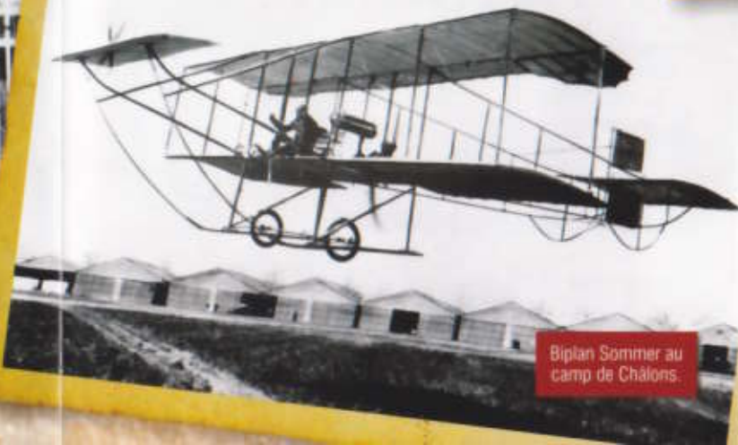
Biplan Sommer au camp de Châlons.