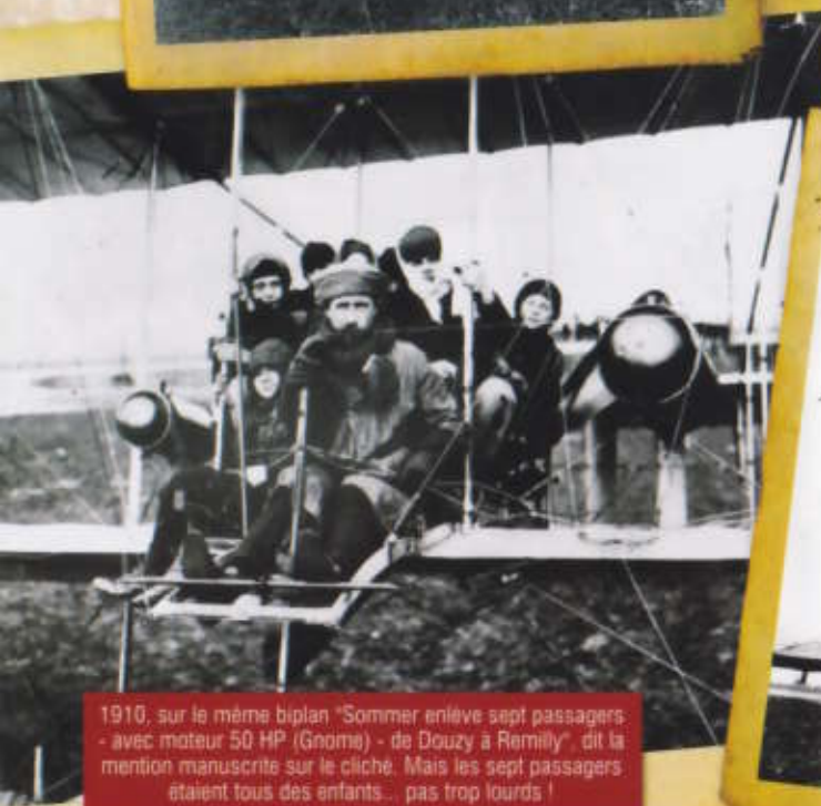
1910, sur le même biplan "Sommer enlève sept passagers - avec moteur 50 HP (Gnome) - de Douzy à Remilly", dit la mention manuscrite sur le cliché. Mais les sept passagers étaient tous des enfants... pas trop lourds !